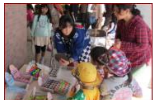
桂文化祭 駄菓子店の風景