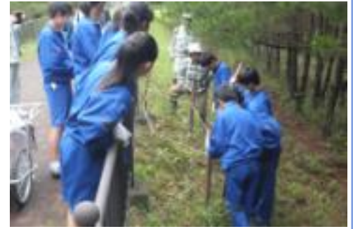
草花保護作業の風景